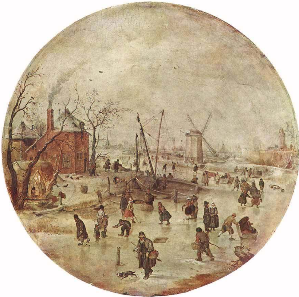
Hendrick Avercamp (1585-1634)